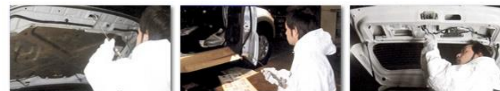
ボンネット、ドアパネル、トランク内部への防錆加工