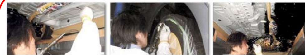
フレーム、アンダーフロア、タイヤハウスへの防錆加工